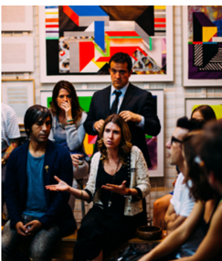
Comunicació i Fundraising