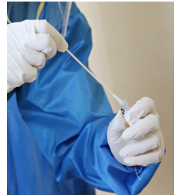
Suport a la recerca (Clinical Research Organization)