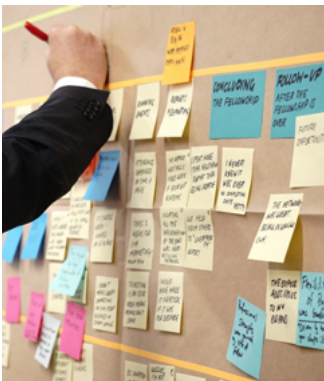
Docència / FLS-Science