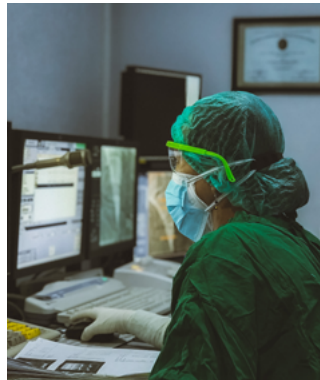
Suport a la recerca (Clinical Trial Unit)